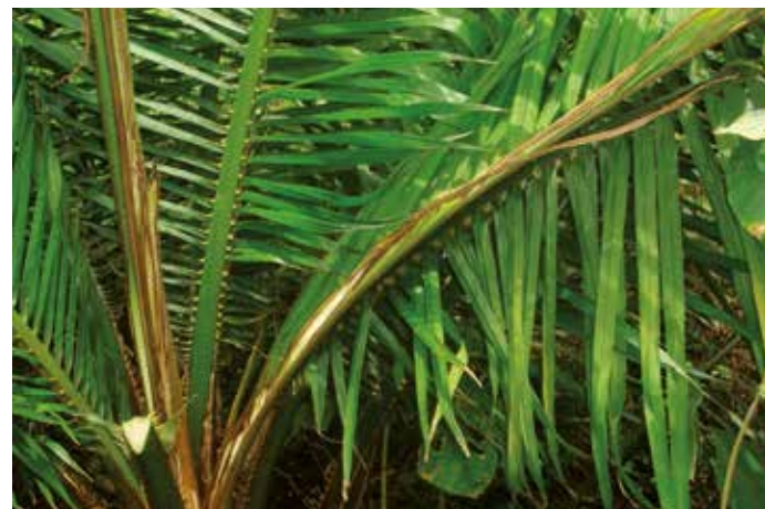
Palma afectada por Pudrición del cogollo