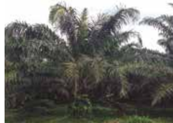
2. Acortamiento en hojas jóvenes