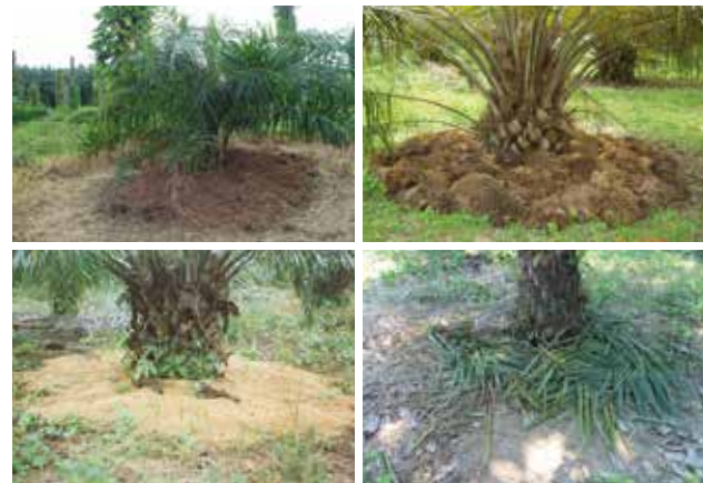
Aplicación de tusa, raquis, fibra, hojas al plato de la palma.

Evite el uso de insecticidas químicos para preservar la fauna benéfica.