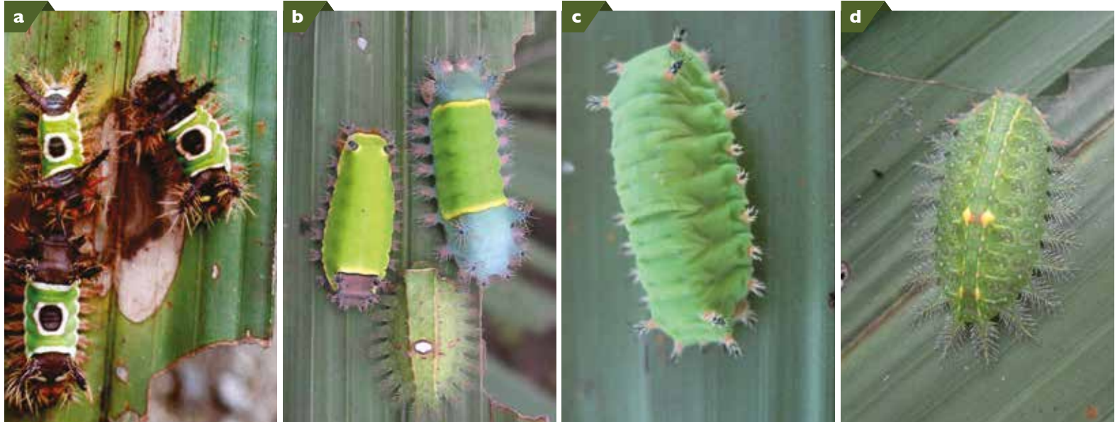
A. Larva Sibine megasomoides . B. Larva de Episibine sp., Sibine fusca , Natada subpectinata . C. Sibine pallescens . D. Adulto de Euprosterna elaeasa .