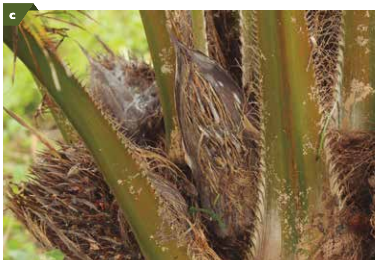
Palma afectada con Marchitez letal