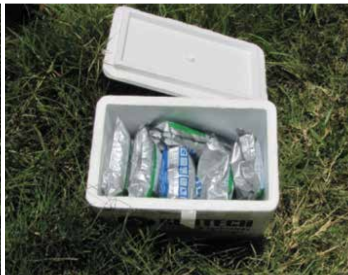
Mantenga refrigerado el producto biológico, con el fin de preservar su calidad.