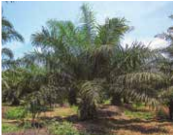
1. Clorosis apical en hojas jóvenes