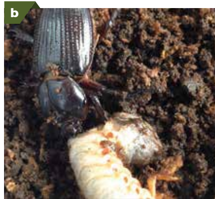
Control biológico. a. Larva de Strategus aloeus afectada por Metarhizium anisopliae . b. Phileurus didymus depredando larvas de Strategus aloeus .