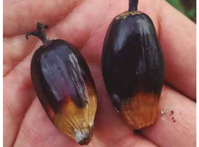
Detalle del desprendimiento de fruto en palma afectada por ML