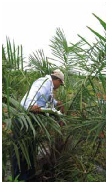
Censo fitosanitario en palma joven.