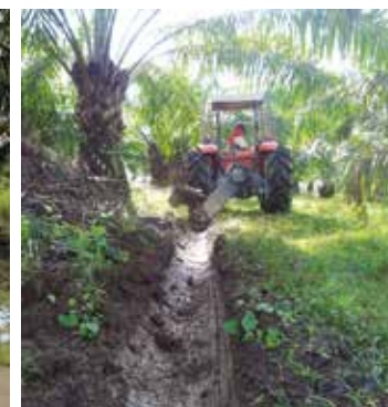
Después del drenado con ditcher .