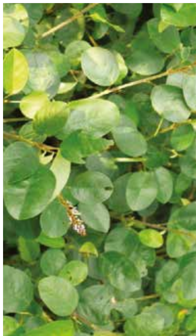
Desmodium ( Desmodium heterocarpon ) y Maquenque ( Desmodium heterocarpon subsp. Ovalifolium cv. Maquenque ).