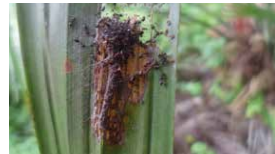
Larva de Stenoma cecropia .