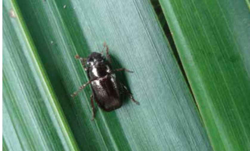
Leucothyreus femoratus adulto.

El establecimiento de coberturas antes de la siembra de las palmas en el cultivo evita las defoliaciones severas de Leucothyreus femoratus .