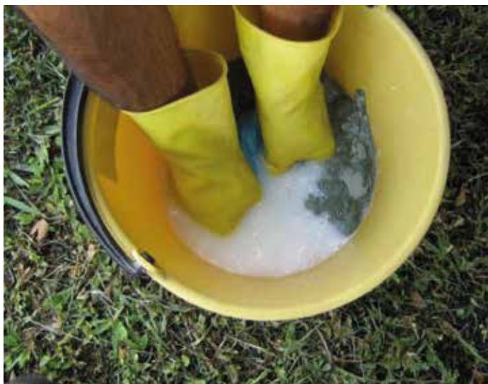
Uso de coadyuvante para mayor adhesión del producto biológico.