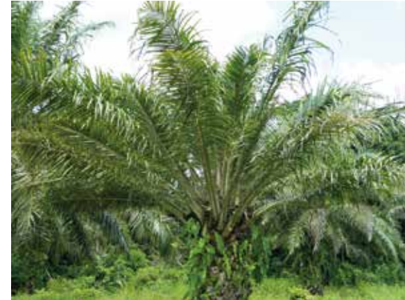
Palma afectada por Anillo rojo