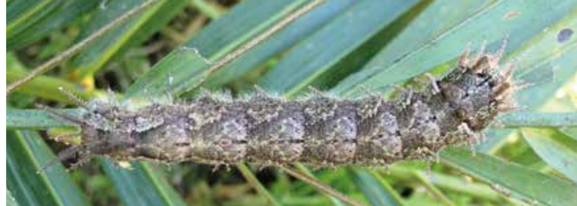
Larva de Dirphia gragatus causando defoliación.

El Dirphia gragatus tiene diversidad de enemigos naturales y, al igual que en otras plagas, la recolección de posturas y larvas, y el mantenimiento de plantas con nectarios extraflorales contribuyen a su control. Cuando se presentan brotes de la plaga no se deben usar insecticidas químicos ya que estos también acaban con la fauna benéfica. Se recomienda aplicar la bacteria Bacillus thuringiensis disponible en el mercado.