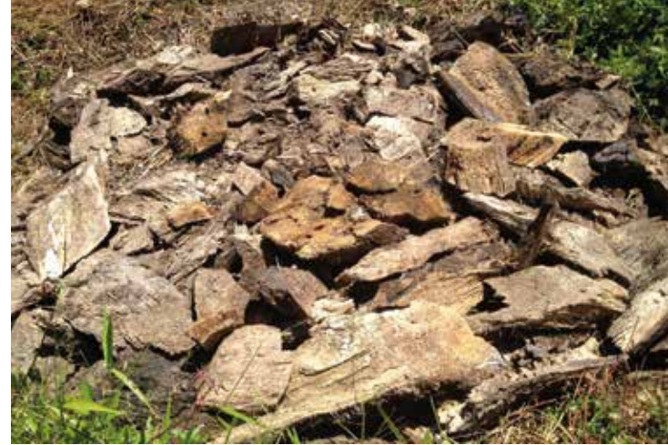
Trozos de estípite de menos de 15 cm apilados lejos de los sitios de siembra.