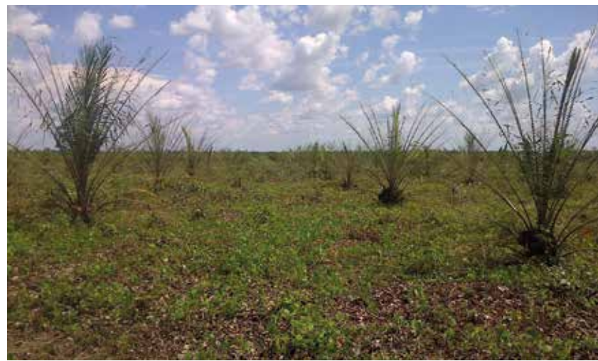
Defoliación severa causada por Automeris liberia .