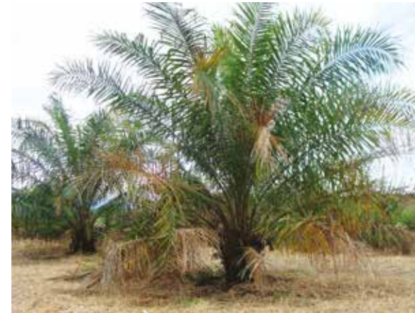
Palma afectada por Marchitez letal