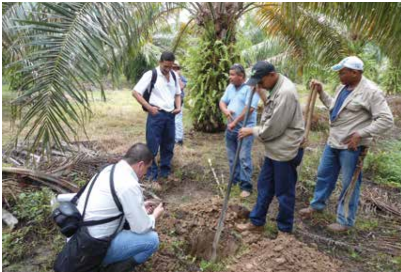
Observación de las propiedades del suelo.

Es indispensable conocer e interpretar los niveles críticos en el suelo ya que a partir de ellos se estima la disponibilidad de los nutrimentos. Para su interpretación se establecieron tres escalas: baja, media y alta (óptima), y es a partir de esta última que se generan desbalances nutricionales. El reconocimiento y valoración de la disponibilidad de nutrimentos en suelo se hace a través de análisis que permiten determinar la textura y los diferentes parámetros químicos relacionados con la fertilidad. Normalmente en palmas menores a tres años, se realizan análisis de suelos una vez al año y en palmas mayores a tres años, cada dos años.