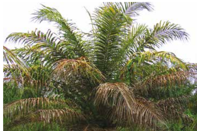
Palma afectada por Marchitez sorpresiva

Por el comportamiento de la PC en los Llanos Orientales no es obligatorio realizar labores de remoción de tejidos enfermos, eliminación de palmas, ni se intensifican los censos fitosanitarios al aumentar las incidencias. Si la enfermedad se llega a presentar con características letales esta excepción pierde vigencia.