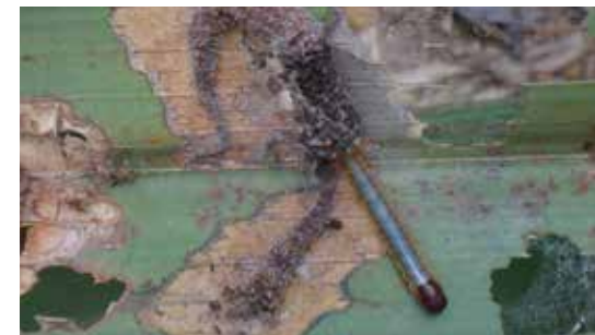
Daño ocasionado por larvas de Stenoma cecropia .