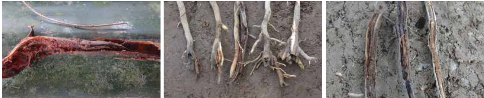
Afectación de raíces por larvas de Sagalassa valida . Daño continuo: formación de doble raíz o bifurcación.