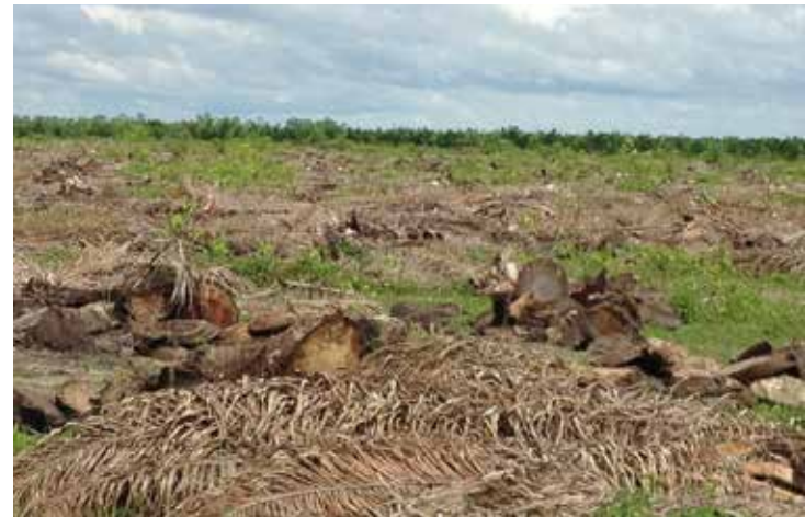
Trozos de estípite esparcidos e incorporados en áreas de siembra.