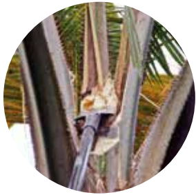
1. Remueva el tejido enfermo.