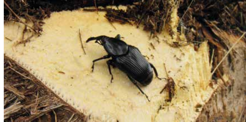
Vector: picudo negro ( Rhynchophorus palmarum ).

Es una enfermedad letal de la palma de aceite causada por el nematodo Bursaphelenchus cocophilus y diseminada por los adultos del picudo negro Rhynchophorus palmarum L., su vector. Los principales síntomas permiten la identificación en campo.