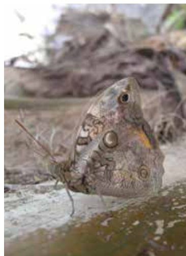
Adulto de Opsiphanes cassina .