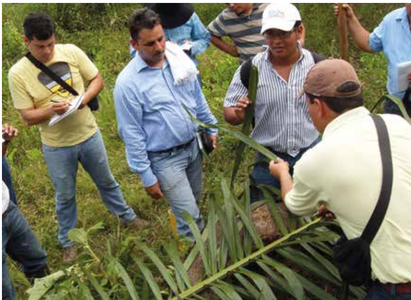
Toma de muestra foliar.

Para conocer los niveles de nutrimentos en el tejido foliar es necesario realizar un análisis químico del mismo. Se recoge una muestra de un área relativamente uniforme en cuanto al tipo de suelo, topografía, material de siembra y edad del cultivo. En palmas menores a cuatro años se toma en la hoja No. 9 y, en palmas mayores a cuatro años, en la hoja No. 17. Se recomienda hacerlo anualmente en el mismo periodo del año, dos meses después de la última fertilización y tres meses antes de la próxima, en épocas de condiciones climáticas no extremas y antes del mediodía.