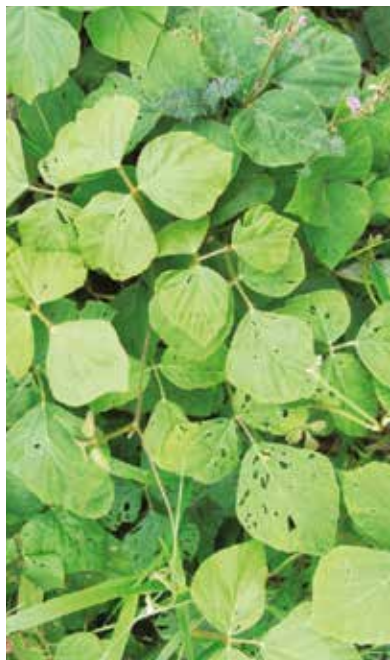
Kudzú ( Pueraria phaseoloides )