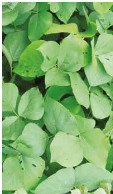
Mucuna ( Mucuna bracteata )