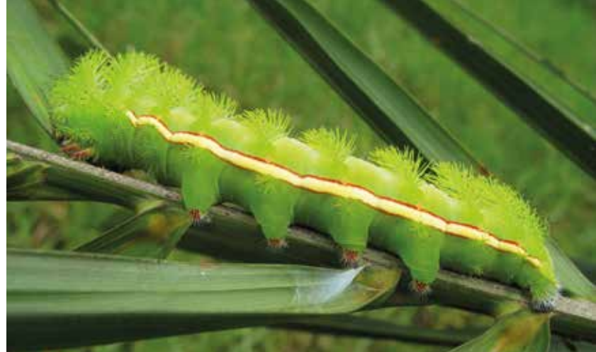
Larva de Automeris liberia alimentándose del follaje de la palma.