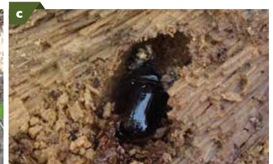
Afectación en palma producida por Strategus aloeus . a) Adulto penetrando el bulbo; b) Daño causado en el estípite de la palma; c) Adulto hembra ovipositando en residuos de palma.