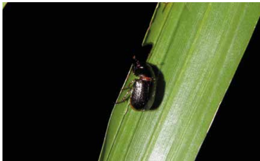
Daño causado por Leucothyreus femoratus .