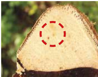
4. Manchas color anaranjado (salmón) y apariencia aceitosa