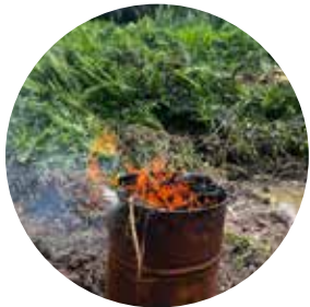
2. Flamee el área expuesta.