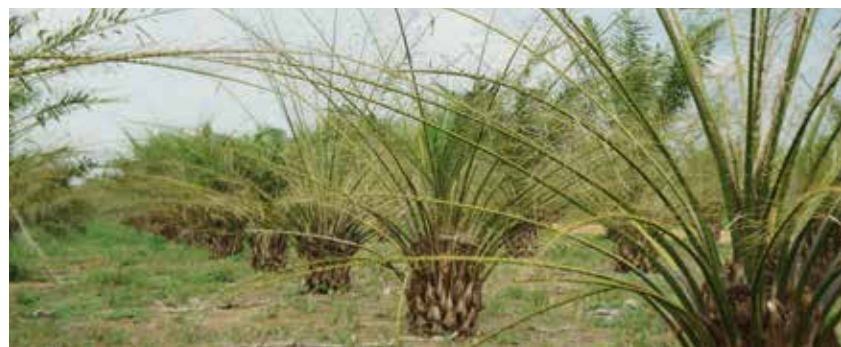
Defoliación severa causada por Dirphia gragatus .