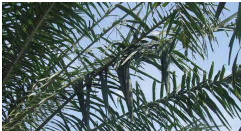
Defoliación por Brassolis sophorae .