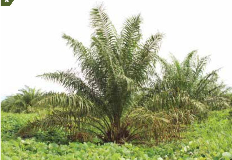
Palma afectada con Marchitez letal