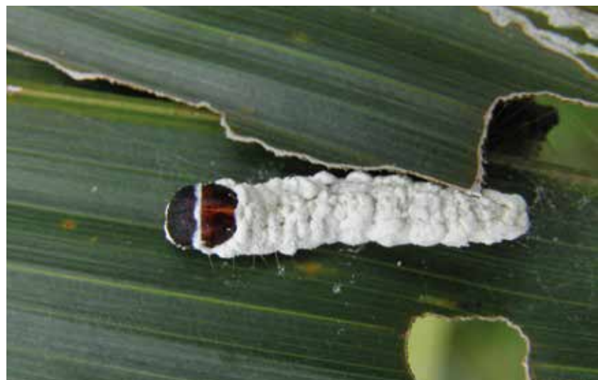
Consumo del parénquima foliar por larvas del VII instar y defoliación por larvas de XI instar de Loxotoma elegans .