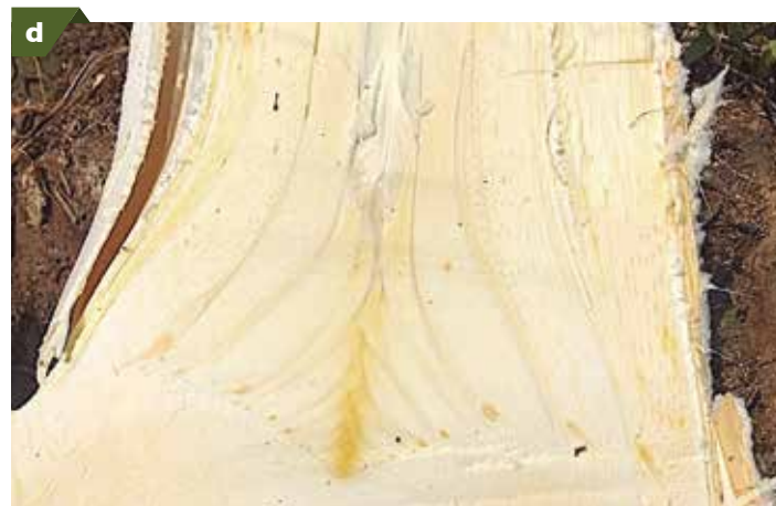
Palma afectada con Marchitez letal