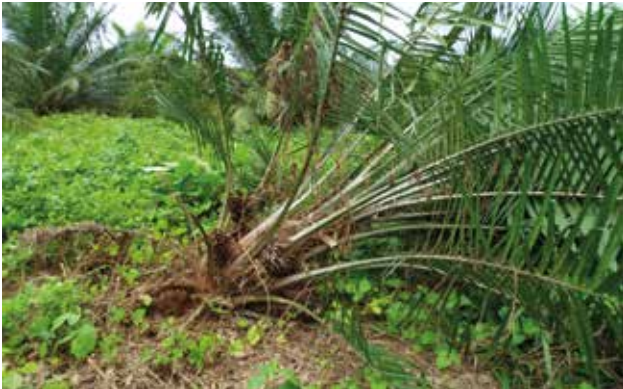
Volcamiento de palma causada por daño de Sagalassa valida en las raíces.

Como consecuencia del ataque del insecto barrenador, las palmas presentan mal anclaje y volcamiento. El daño continuo en el sistema de raíces genera alteraciones fisiológicas que se reflejan en un mal desarrollo y lento crecimiento, amarillamiento y secamiento prematuro de las hojas basales e intermedias, emisión constante y prolongada de inflorescencias masculinas, reducción del tamaño y peso de los racimos.