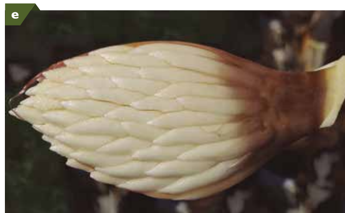
Palma afectada con Marchitez letal