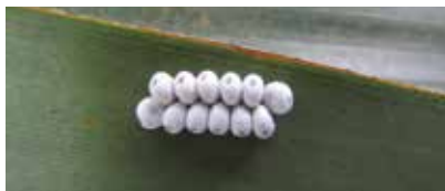
Huevos de Automeris liberia depositados en las hojas de la palma.