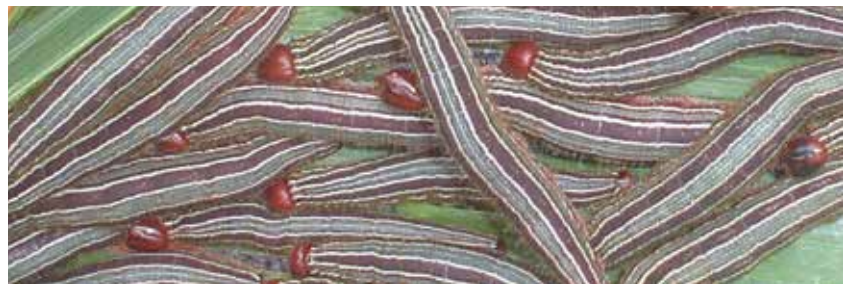
Larvas de Brassolis sophorae .