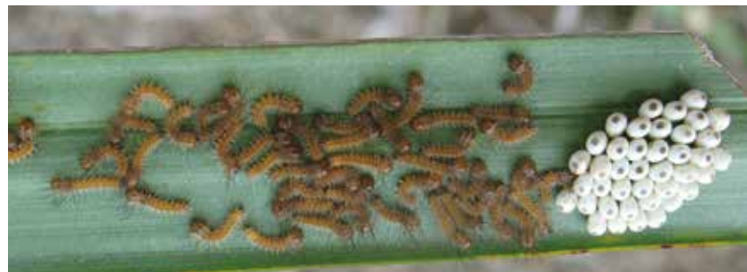
Larvas recién emergidas de Dirphia gragatus .