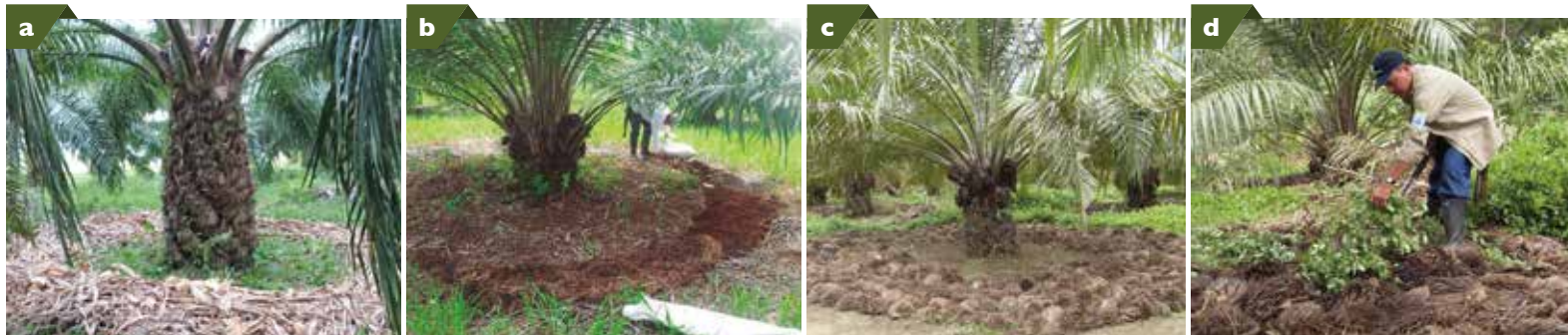
a. Aplicación de panca (residuos de cosecha) de maíz. b. Aplicación de compostaje. c. Aplicación de racimos desfrutados (tusas). d. Aplicación de coberturas de leguminosa.