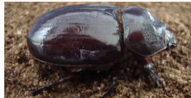
El insecto macho de Strategus aloeus posee cuernos en su parte delantera mientras que la hembra no los tiene.