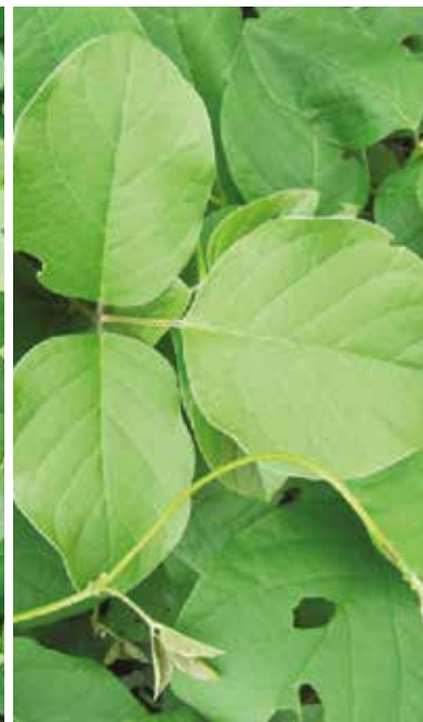
Canavalia ( Canavalia brasiliensis y Canavalia ensiformis )