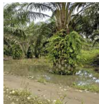
Antes del drenaje con ditcher .

Antes del inicio del periodo de lluvias se deben limpiar los canales con el fin de permitir una rápida evacuación del agua.