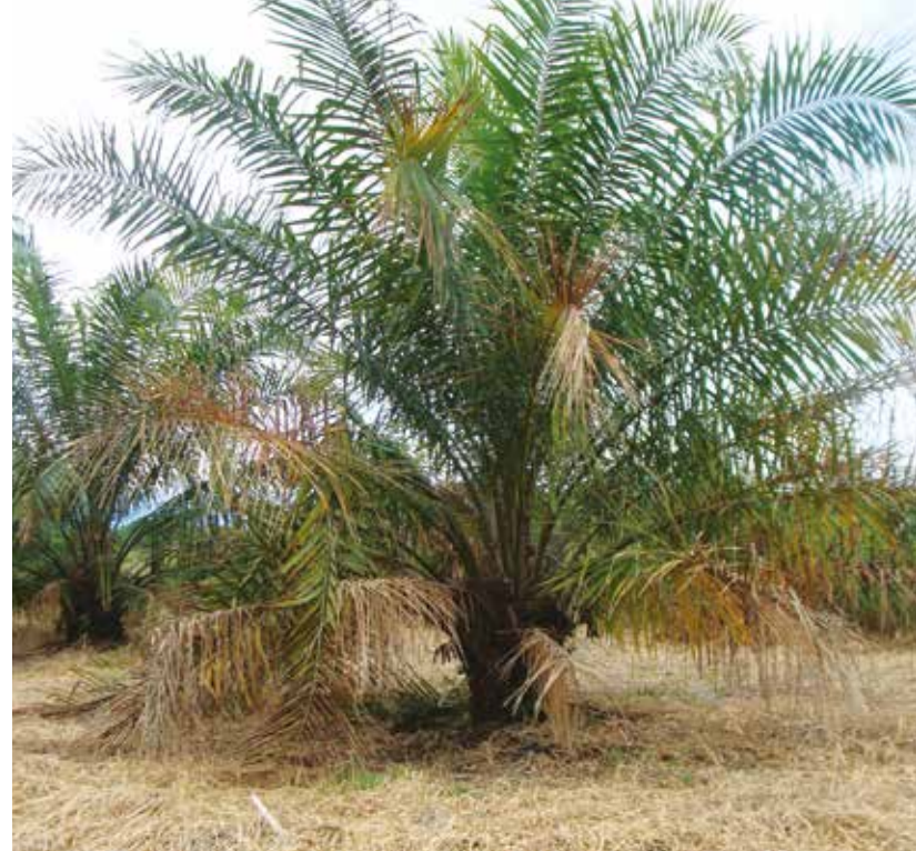
Palma afectada con Marchitez letal

Cenipalma, a través del Programa Sectorial de Manejo Fitosanitario, ha logrado consolidar, entre otras iniciativas, que los palmicultores de la Zona Oriental prioricen el seguimiento y manejo fitosanitario con el fin de atender de manera más eficiente la problemática ocasionada por esta enfermedad. Es así, como desde el año 2010 se estableció un Convenio Empresarial que vincula a 20 Núcleos Palmeros con una cobertura de más de 172.000 ha. Estas empresas han perdido cerca de un millón de palmas por ML, de las cuales 353.000 se reportaron entre los años 2017 y 2018.