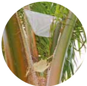
3. Aplique productos para su protección