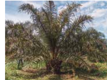
3. Apiñamiento por acumulación de hojas jóvenes cortas