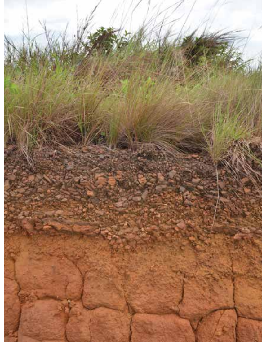
Perfil del suelo en tiempo de sequía.