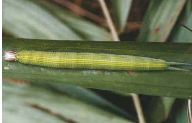
Larva de Opsiphanes cassina .